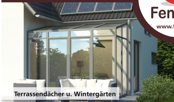
Terrassendächer u. Wintergärten