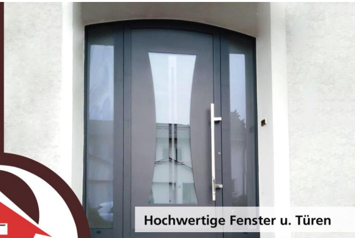
Hochwertige Fenster u. Türen