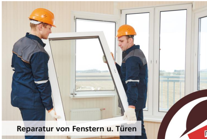
Reparatur von Fenstern u. Türen