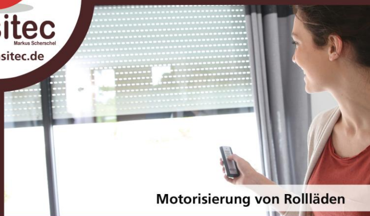
Motorisierung von Rollläden