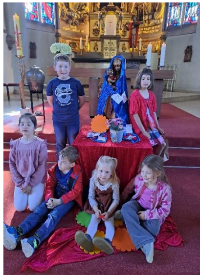
Bereitung des Maialtares