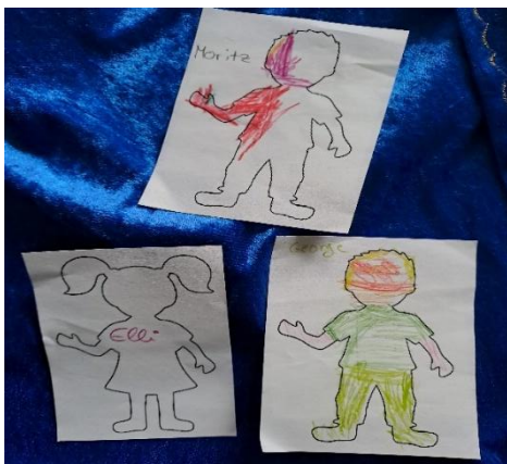
Maria hält uns alle unter ihrem schützenden Mantel